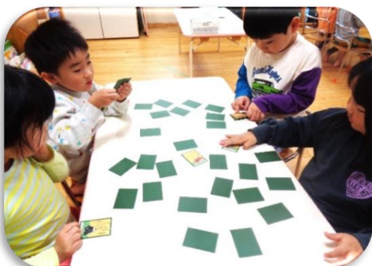
4歳児 友だちと坊主めくり♪