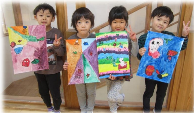
5歳児 たこつったよ♪